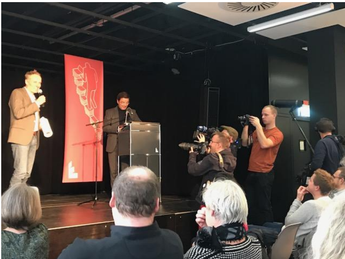
Die Presse dokumentiert alles