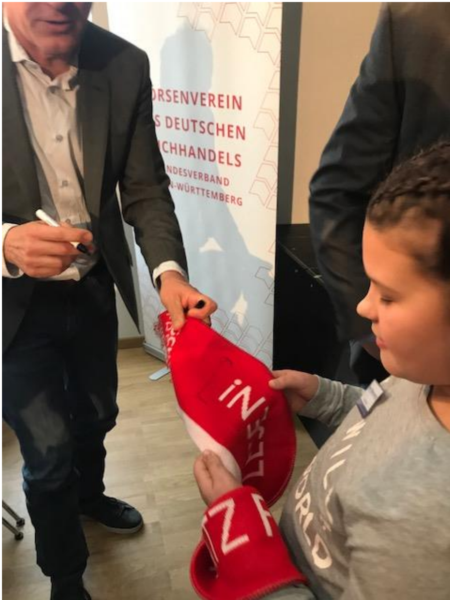
Ein Autogramm auf dem Schal