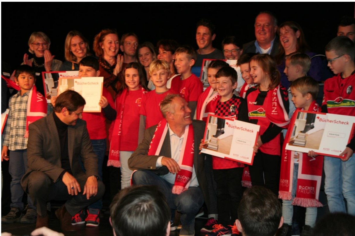
Alle acht Kooperationsschulen